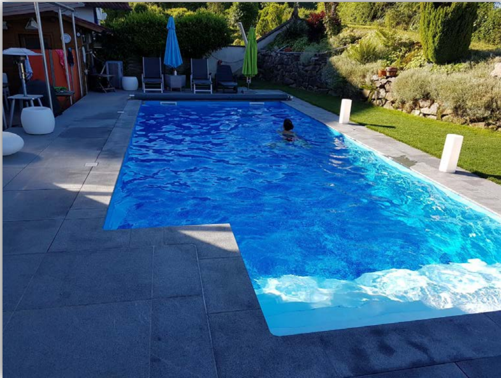
Tag 13 Genießen