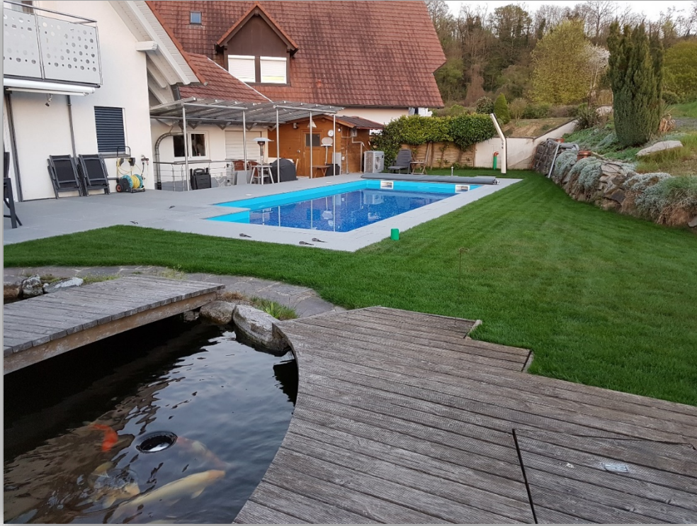
Tag 13 Inbetriebnahme des Pools